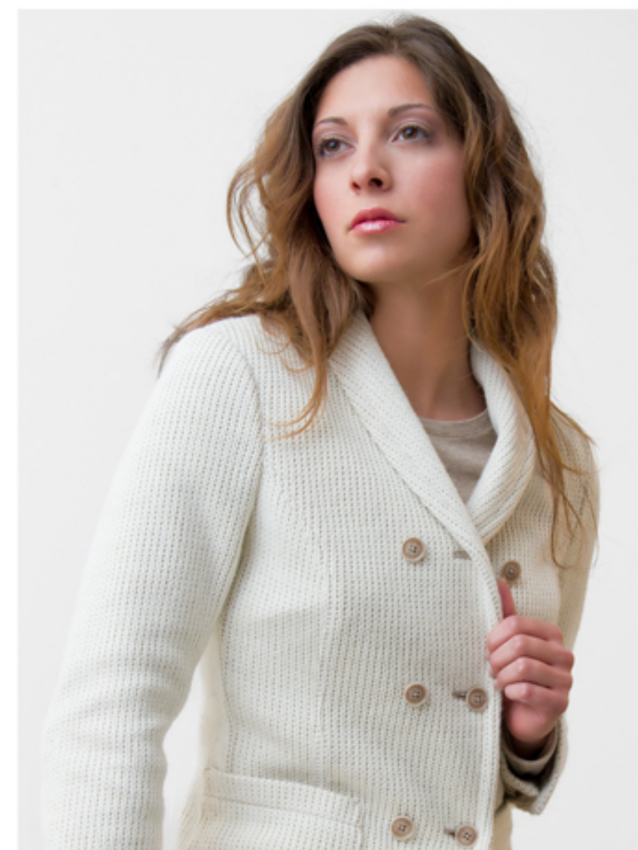
Giacca doppiopetto in lana e cotone - bottoni in corozo Colori: bianco