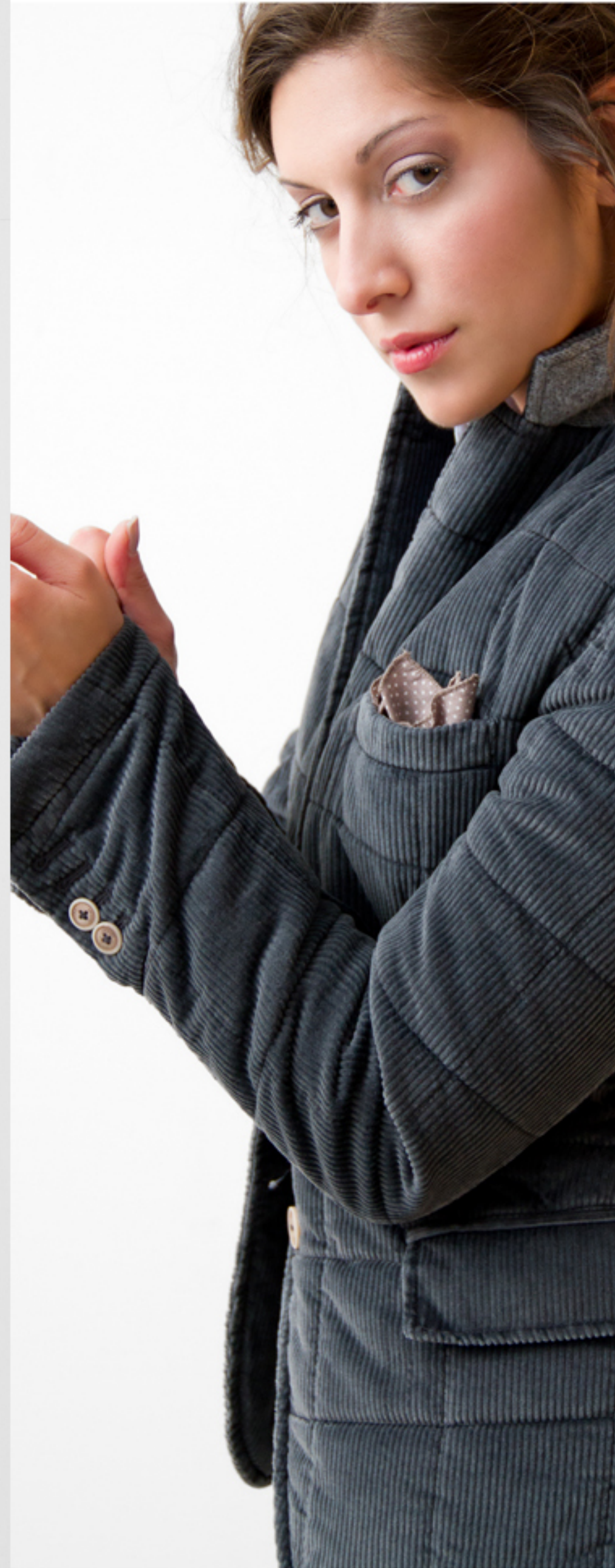
Giacca trapuntata a costine di velluto - bottoni in corozo Colori: antracite - blu navy - verde pastello