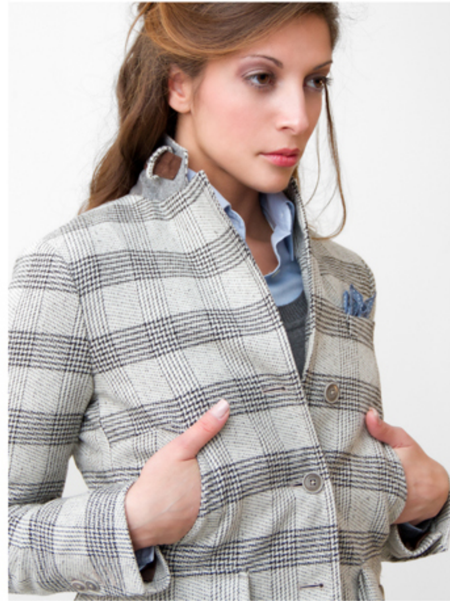
Giacca in lana con trama a quadro grande - bottoni in corozo Colori: bianco/anthracite - cammello/anthracite

Wool jacket with a large checked weave - corozo buttons Colours: white/anthracite - camel/anthracite