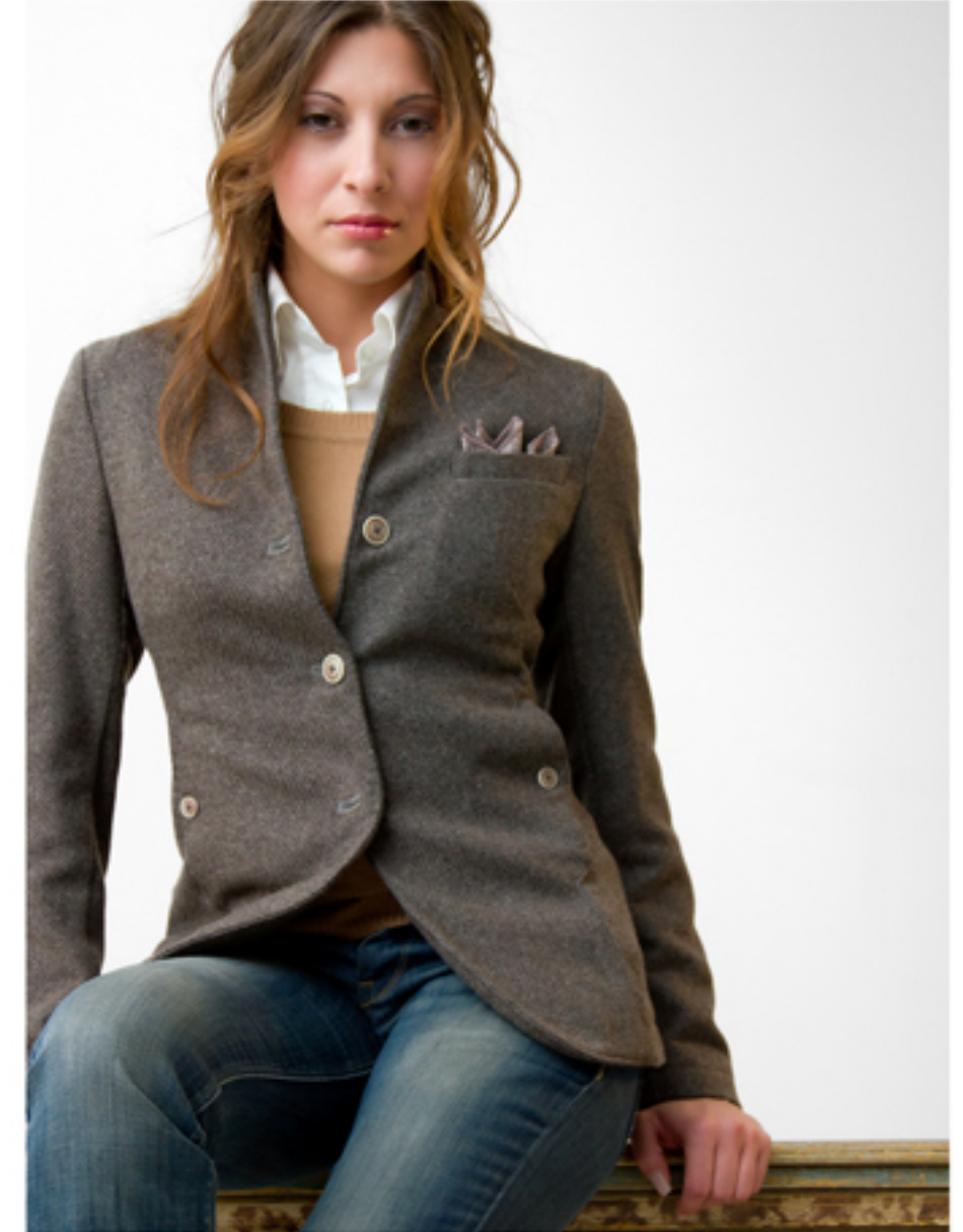
Giacca in lana con trama rigata e toppa in velluto - bottoni in corozo Colori: blu navy - grigio - marrone - tortora