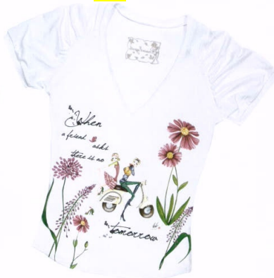
ROSSO REGALE: DIRLO COI FIORI Viene realizzata in una sartoria fiorentina d'alta moda la T-shirt, 113 euro.