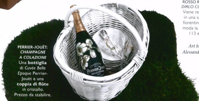
PERRIER-JOUËT: CHAMPAGNE A COLAZIONE Una bottiglia di Cuvée Belle Époque Perrier-Jouët e una coppia di flûte in cristallo. Prezzo da stabilire.