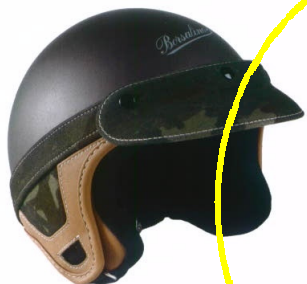
BORSALINO: IN SICUREZZA Casco camouflage in materiali termoplastici, con dettagli in rafia ed ecopelle cuciti a mano. Circa 250 euro.