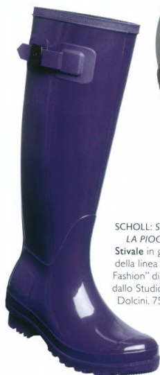
SCHOLL: SCENDE LA PIOGGIA Stivale in gomma della linea "Scholl Fashion" disegnata dallo Studio Diego Dolcini. 75 euro.