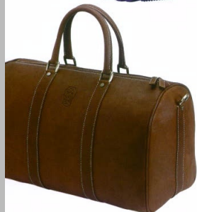
BERETTA: A PROVA DI VOLO Qui sopra, borsone Castagneto Bag, della "Beretta 1526 Leather line" in pelle di bufalo, 924 euro. Sopra, a destra, trolley B/One in pelle e canvas, adatto per viaggi aerei, 218 euro.